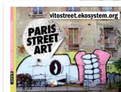
ILUSTRACIÓN: GRÁFICO 3